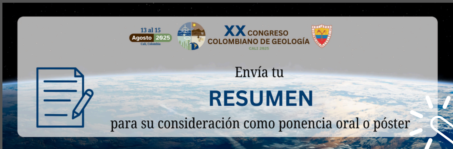
Imagen con enlace al formulario. Solo funciona en la versión PDF de esta Circular.

El Comité Organizador del CCG2025 invita a enviar resúmenes de ponencias para presentaciones orales o posters en la 20 a versión del Congreso Colombiano de Geología (CCG) .